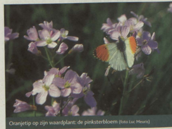
Oranjetip op zijn waardplant: de pinksterbloem